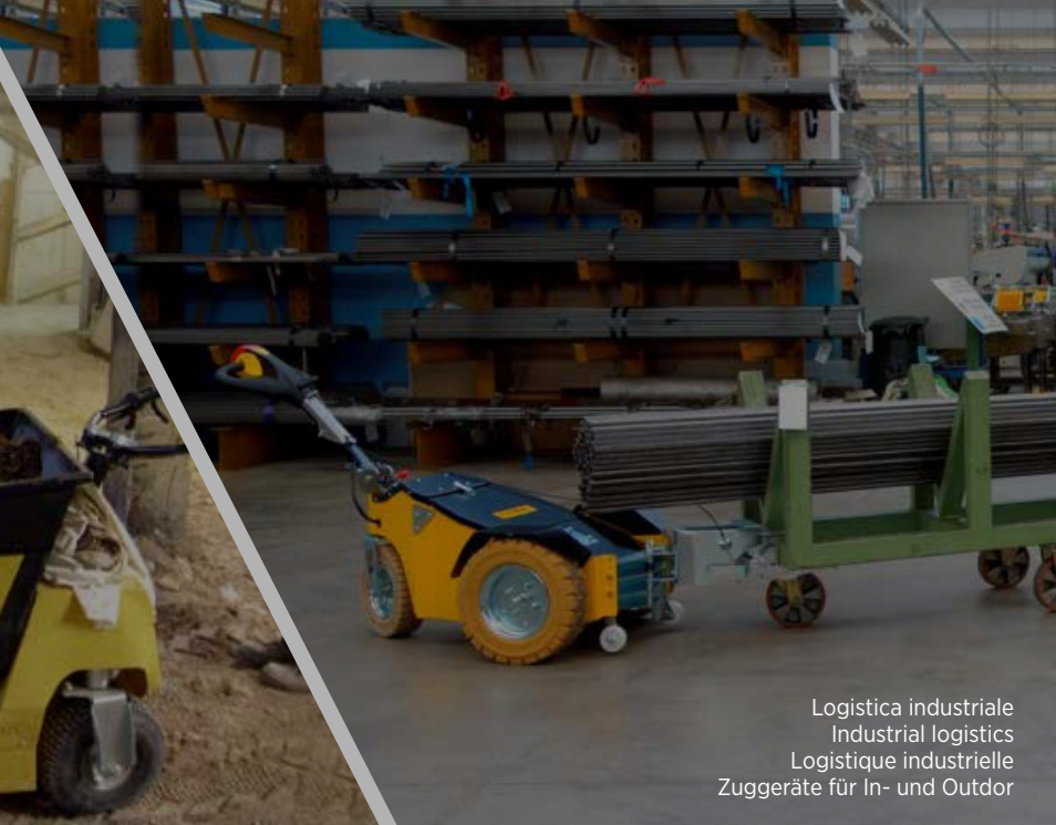
Logistica industriale Industrial logistics Logistique industrielle Zuggeräte für In- und Outdoor