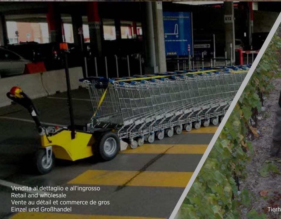
Vendita al dettaglio e all'ingrosso Retail and wholesale Vente au détail et commerce de gros Einzel und Großhandel