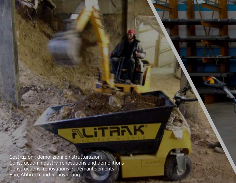
Costruzioni, demolizioni e ristrutturazioni Construction industry, renovations and demolitions Constructions, rénovations et démantèlements Bau, Abbruch und Renovierung