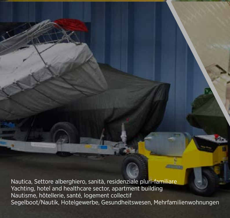
Nautica, Settore alberghiero, sanità, residenziale pluri-familiare Yachting, hotel and healthcare sector, apartment building Nautisme, hôtellerie, santé, logement collectif Segelboot/Nautik, Hotelgewerbe, Gesundheitswesen, Mehrfamilienwohnungen