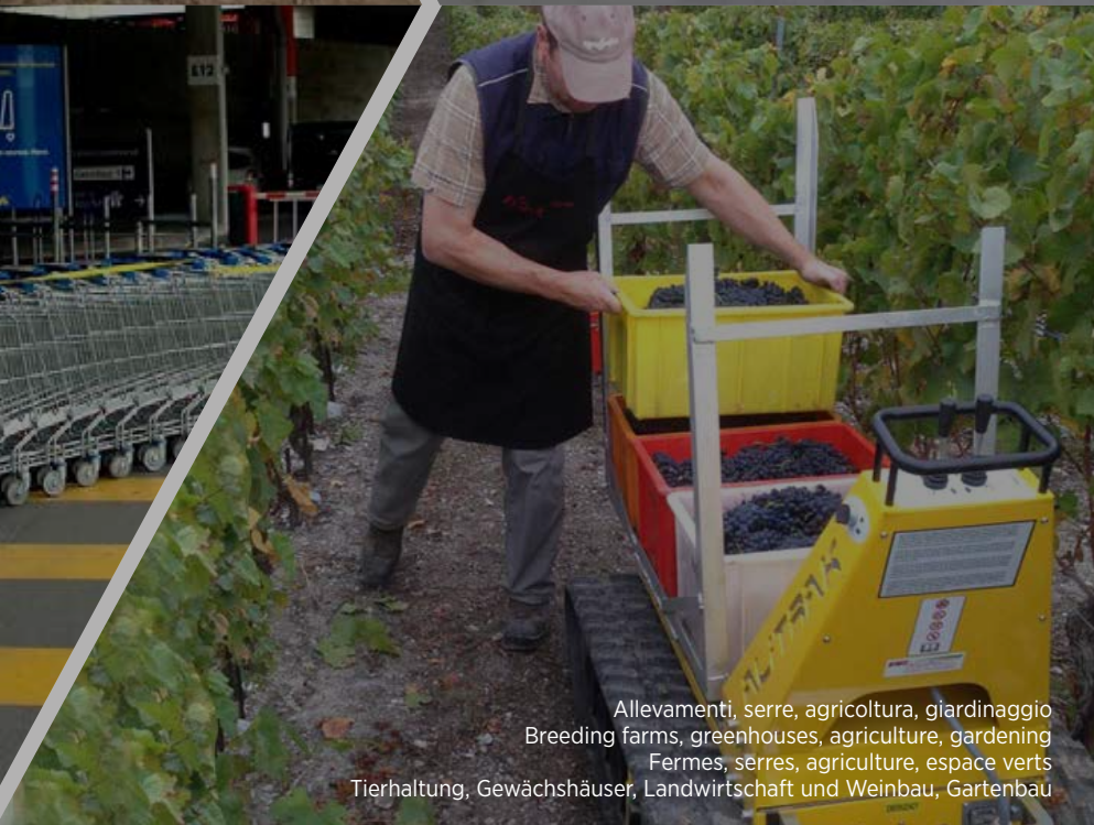
Allevamenti, serre, agricoltura, giardinaggio Breeding farms, greenhouses, agriculture, gardening Fermes, serres, agriculture, espace verts Tierhaltung, Gewächshäuser, Landwirtschaft und Weinbau, Gartenbau